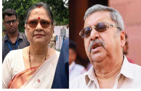
खासकर इसलिए क्योंकि शिकायतकर्ता और आरोपी दोनों एक ही राजनीतिक दल से हैं। इस घटना को तृणमूल कांग्रेस के अंदर बढ़ती

से बनर्जी के खिलाफ औपचारिक शिकायत दर्ज करने की अनुमति मांगी है। उन्होंने आरोप लगाया कि बनर्जी ने संसदीय कार्यवाही के दौरान जुबानी टिप्पणियों के जरिये उन्हें और कई अन्य महिला सांसदों को बार-बार अपमानित किया है। उन्होंने दावा किया कि ऐसा व्यवहार महिला-विरोधी है और महिला सांसदों के प्रति अपमानजनक है। उन्होंने श्री बिरला से संसद में ऐसी घटनाओं को रोकने के लिए जरूरी कदम उठाने का आग्रह किया। इस घटनाक्रम ने ज़ोरदार राजनीतिक चर्चा छेड़ दी है,